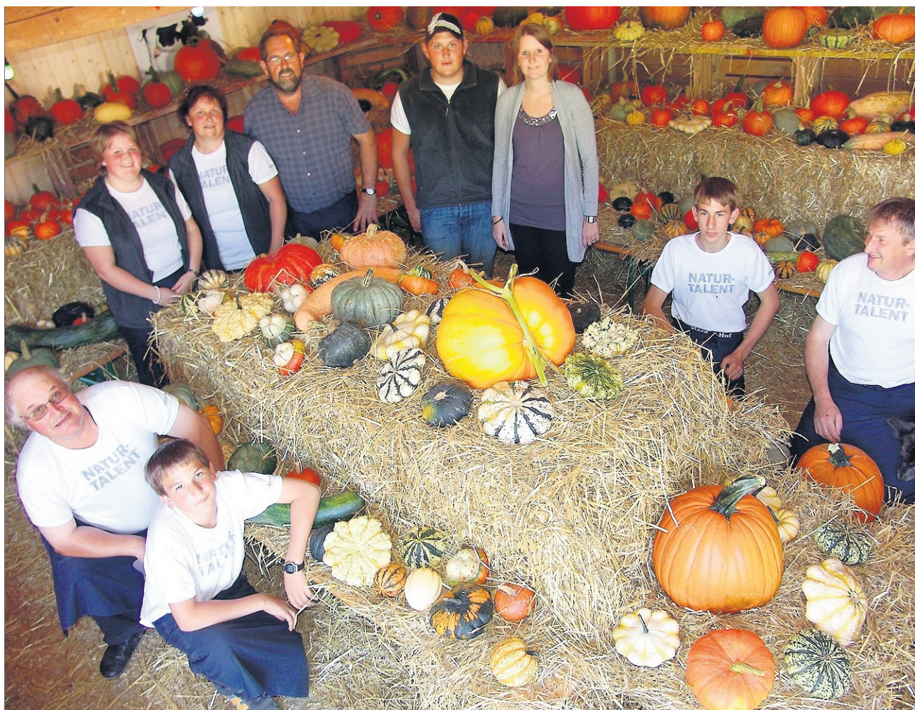
FARBENPRÄCHTIG Auf dem Hof der Familie Stalder gibt es Kürbisse in allen Variationen.